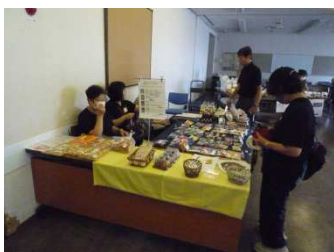
各機関の出店ブースの様子