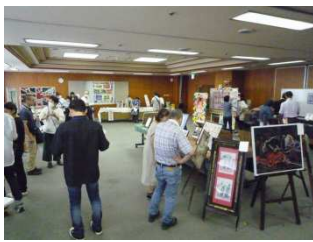
メイン会場の様子