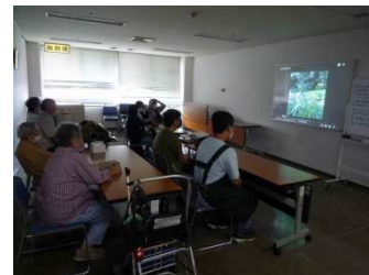
音楽・映像コーナー